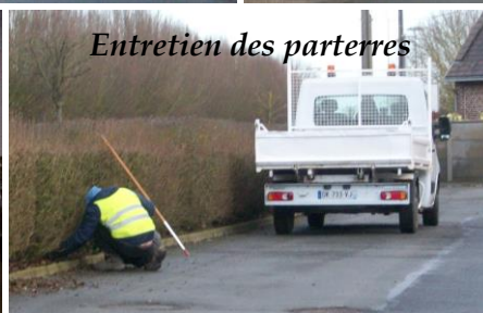
Entretien des parterres