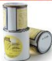
Pots de Peinture