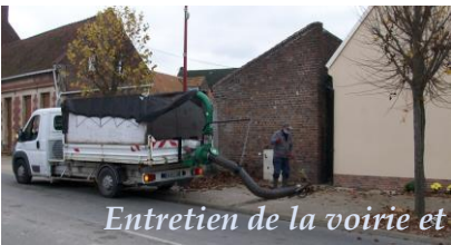
Entretien de la voirie et des trottoirs