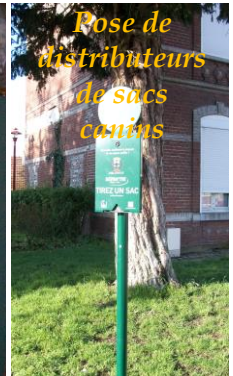
Pose de distributeurs de sucs canins