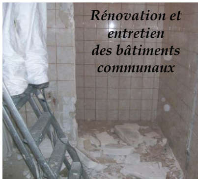
Rénovation et entretien des bâtiments communaux