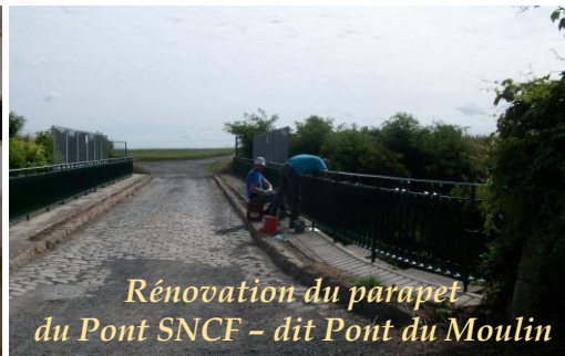
Rénovation du parapet du Pont SNCF - dit Pont du Moulin