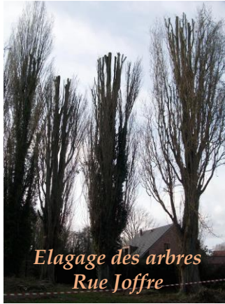
Elagage des arbres Rue Joffre