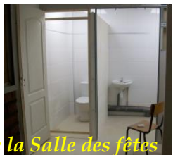
de la Salle des fêtes