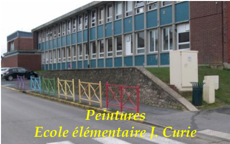
Peintures Ecole élémentaire J. Curie