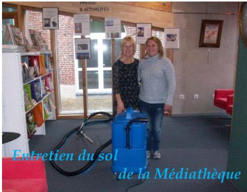
Entretien du sol de la Médiathèque