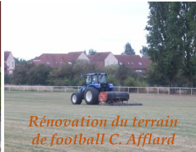
Rénovation du terrain de football C. Afflard