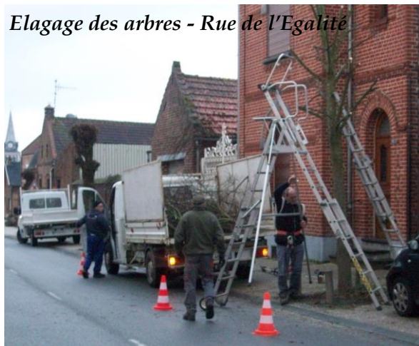
Elagage des arbres - Rue de l'Egalité

Les quelques photos ci-dessous vous retracerons une petite partie des travaux qui ont été réalisés au cours de cette année 2020 :