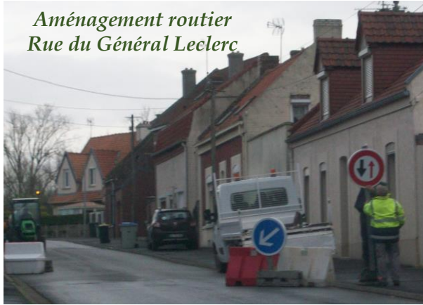
Aménagement routier Rue du Général Leclerc