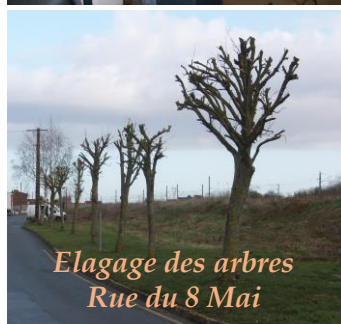
Elagage des arbres Rue du 8 Mai