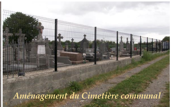
Aménagement du Cimetière communal