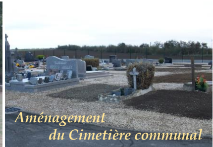
Aménagement du Cimetière communal