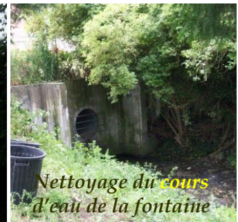
Nettoyage du cours d'eau de la fontaine