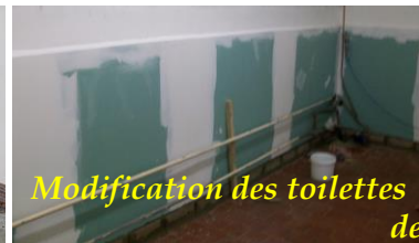
Modification des toilettes