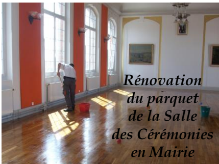
Rénovation du parquet de la Salle des Cérémonies en Mairie