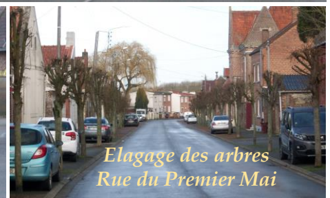
Elagage des arbres Rue du Premier Mai