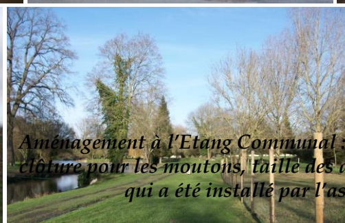
Aménagement à l'Etang Communal : clôture pour les moutons, taille des arbres achat d'un nouveau chalet qui a été installé par l'association « L'Amicale de l'Etang des Cygnes, ... »