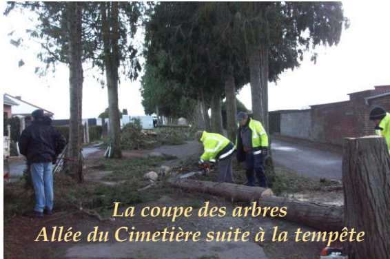
La coupe des arbres Allée du Cimetière suite à la tempête