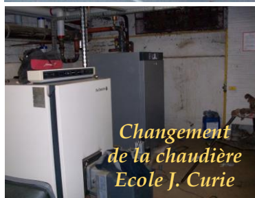
Changement de la chaudière Ecole J. Curie