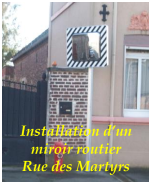
Installation d'un miroir routier Rue des Martyrs