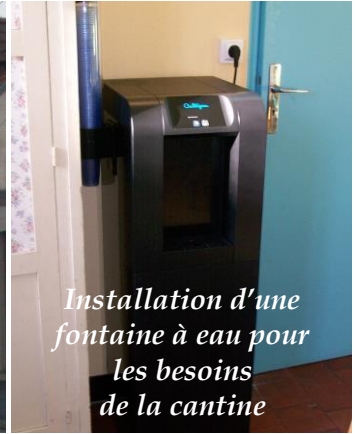
Installation d'une fontaine à eau pour les besoins de la cantine